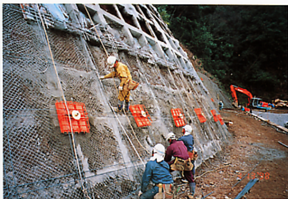
写真-2 1次支圧板実施例